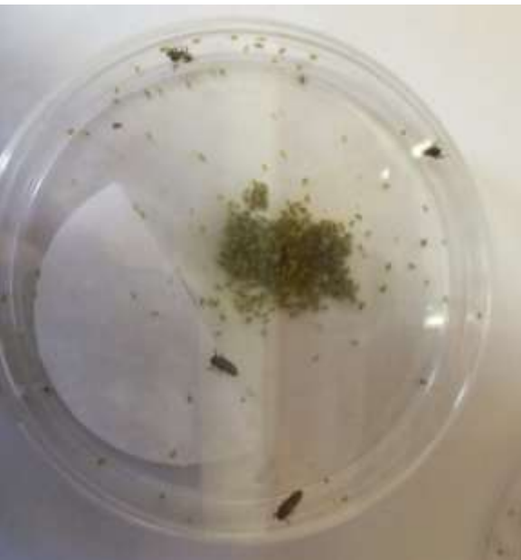
(4) Larves de M. frenata et M. persicae en boîte de Pétri