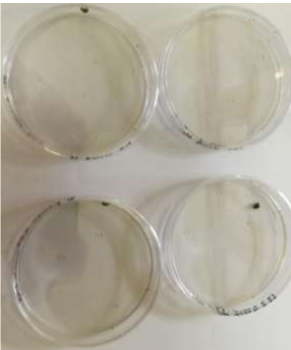
(6) Mise en place de l'essai