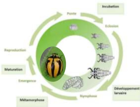
(1) Cycle de Micraspis frenata