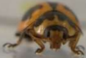
(7) M. frenata adulte