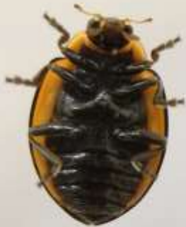
(8) M. frenata adulte