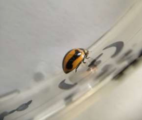
(5) M. frenata adulte en boîte de Pétri