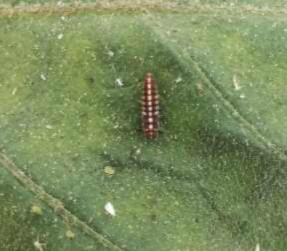
(3) Larve de M. frenata sur feuille d'aubergine